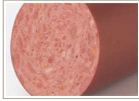
ヤークトブルスト