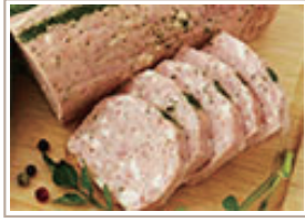
イタリアンケーゼ