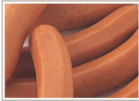
ゲブルツウインナー