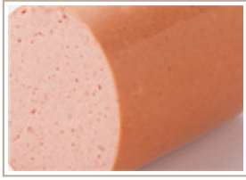
ポークソーセージ