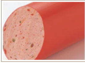
パプリカリヨナー