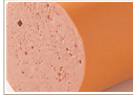
レバーペースト（絹挽き）