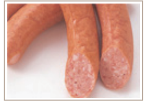
ガーリックチーズ