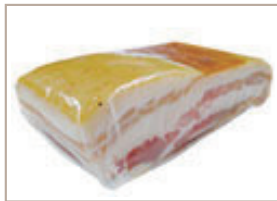
熟成パンチェッタ