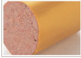
レバーペースト（粗挽き）