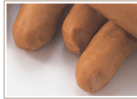
無添加ウインナー