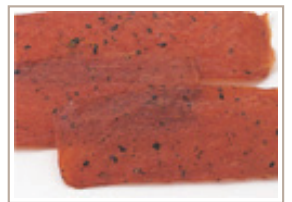
ポークジャーキー