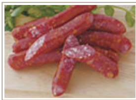
生サラミブルスト