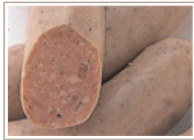
ニュールンベルガー