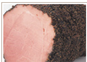
パストラミポーク