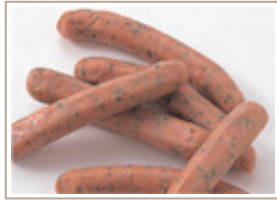
しそ入りウインナー