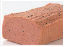
ナチュラルケーゼ